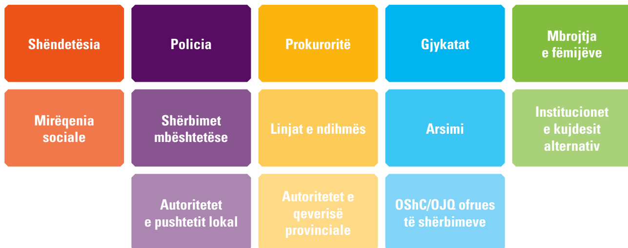
Diagrami 1. Sektorët me burime të të dhënave administrative për fëmijët me aftësi të kufizuara dhe mbrojtjen e fëmijëve

Sfida, megjithatë, qëndron aty se institucionet qeveritare, ofruesit e shërbimeve joqeveritare dhe subjektet private shpesh nuk kanë sisteme të integruara të mbajtjes së të dhënave për të mbledhur rregullisht këto të dhëna, veçanërisht pasi ato kanë të bëjnë me fëmijët me aftësi të kufizuara dhe mbrojtjen e fëmijëve. Nëse ekzistojnë sistemet e mbajtjes së të dhënave, ato zakonisht u përmbahen kërkesave ose nevojave të brendshme. Edhe kur mblidhen të dhëna administrative të bazuara në shërbime që lidhen me fëmijët me aftësi të kufizuara dhe mbrojtjen e fëmijëve, të dhënat rrallë analizohen ose përdoren për monitorimin e efikasitetit të shërbimeve, programeve dhe/ose politikave që ekzistojnë për të mbështetur fëmijët me aftësi të kufizuara dhe/ose fëmijët që kanë nevojë për mbrojtje ose për të përmirësuar qasjen në shërbimet thelbësore për të zvogëluar cenueshmëritë. Përveç kësaj, të dhënat administrative përdoren rrallë për të vlerësuar nëse ka pasur përmirësime në sistemet e mbrojtjes së fëmijëve, duke përfshirë menaxhimin e rasteve për fëmijët në nevojë për mbrojtje dhe mbrojtjen e fëmijëve me aftësi të kufizuara. Në shumë vende, shpesh është gjithashtu e vështirë të gjurmohen rastet dhe referimet fëmijëve në sistemet e mirëqenies sociale, mbrojtjes së fëmijëve, arsimit, kujdesit shëndetësor, policisë dhe drejtësisë.