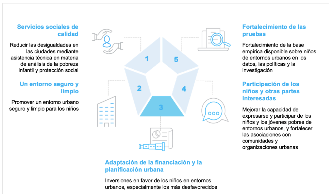
Figura III Esferas prioritarias de la nota estratégica urbana